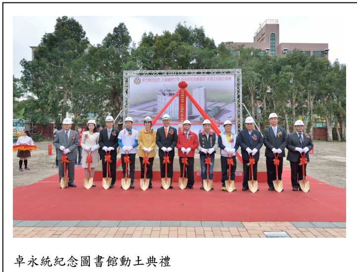
卓永統紀念圖書館動土典禮

上銀科技以 HIWIN 自有品牌行銷全球，專注於傳動控制與系統科技的研發與製造，為全球第二大傳動控制與系統科技的領導品牌。領先同業取得 ISO 9001、ISO 14001、OHSAS 18001 認證、TOSHMS 認證、ISO 14064-1 溫室氣體排放盤查、PAS 2050 產品碳足跡查證及 ISO 13485 醫療器材管理系統認證。HIWIN 產品：滾珠螺桿、線性滑軌、工業機器人、醫療機器人、特殊軸承等精密傳動控制元件，廣泛應用於高精密工業、醫療及智慧自動化產業。