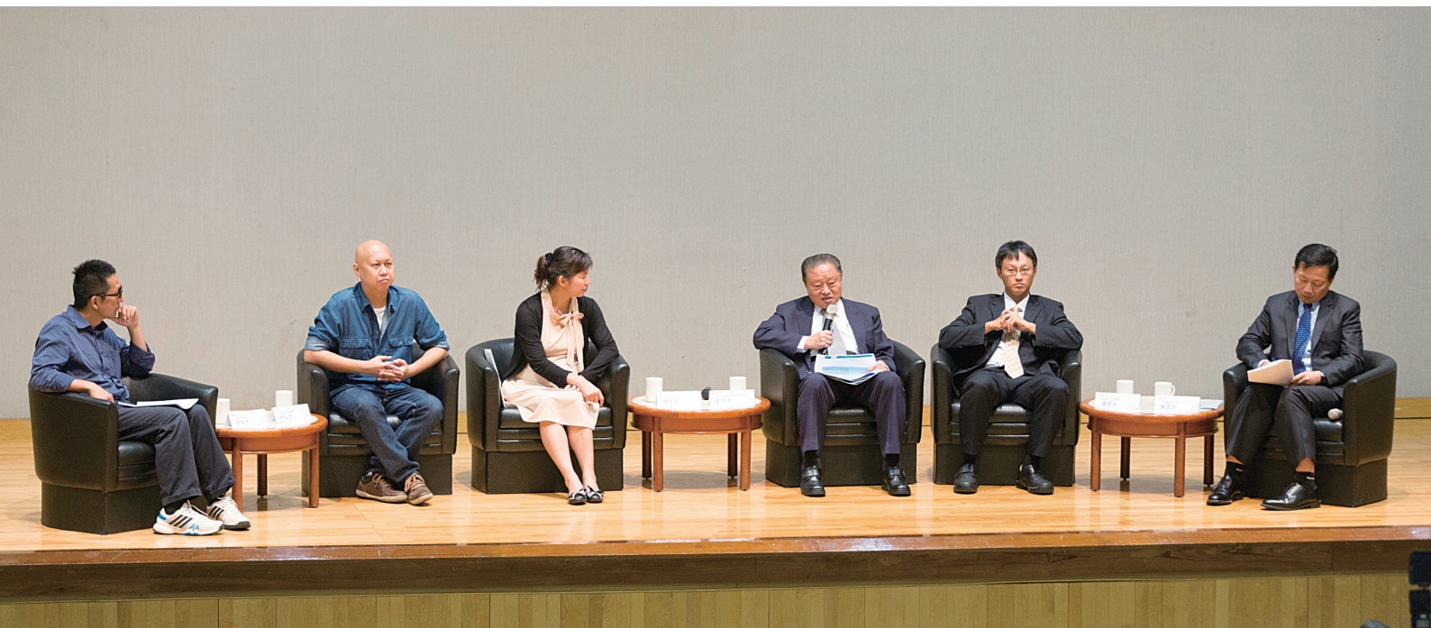
「2014 樂齡悅活科技論壇」藉由各界的參與及座談，激盪出樂齡悅活世代的創新應用與服務。