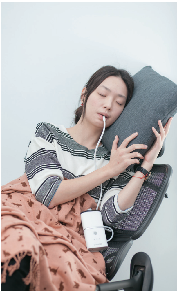
INAP 主機只有香菸盒般大小，採間歇式運轉，在呼吸道阻塞時才開啟，讓呼吸道恢復暢通，故使用者只要含著纖細管線即可安心入睡。