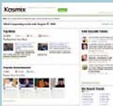
資料來源：The search engines of the future, BBC News 圖片來源：擷取自 http://www.kosmix.com 網站畫面

美國的新創公司Kosmix推出新型的垂直搜尋引擎（vertical search engine）kosmix.com。和傳統搜尋引擎不同的是，Kosmix以垂直搜尋服務的方式，利用其研發的分類搜索技術，針對每一個搜尋事先篩選有用的資訊，動態生成一個多媒體百科的入口，讓搜尋結果就像是由人工編輯過的一樣，讓使用者對搜尋的資料有更完整的了解。如在Kosmix上搜尋Taipei，搜索結果包括相關的旅遊指南、影像圖片和video、美食／住宿推薦、