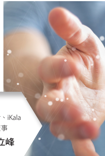
Appier、iKala 董事 簡立峰